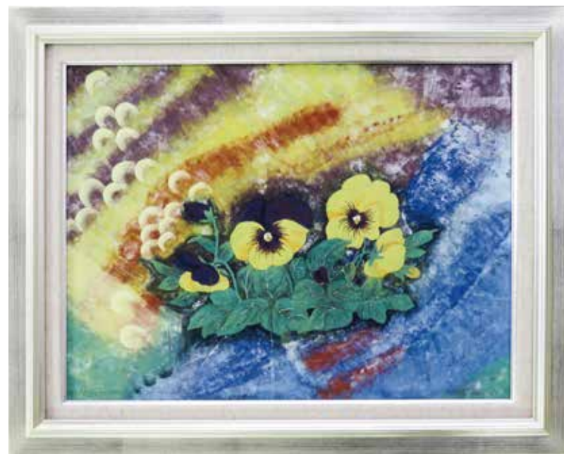
作者／長場順子さん(番田)